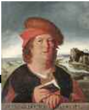
Der Arzt Paracelsus (1493 bis 1541)

Rasch rotierende Schichten fügen der Nachtarbeit offenbar eine zusätzliche Belastung hinzu. Schlimmer noch – die breitere Verteilung der Nachtschichten setzt eine vielfache Anzahl von Beschäftigten dieser Belastung aus.